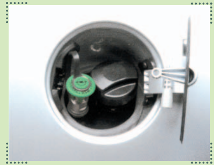
Sicheres Tanken leicht gemacht