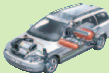
Platzierung der Erdgastanks