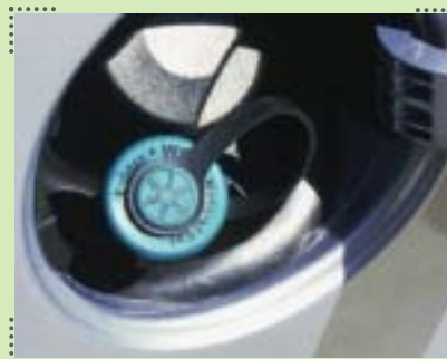
Sicheres Tanken leicht gemacht